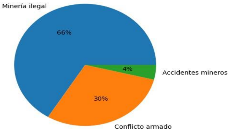
Distribución de muertes por tipo de violencia